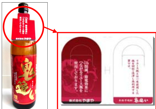
リユース対象商品と首かけポップ(イメージ)